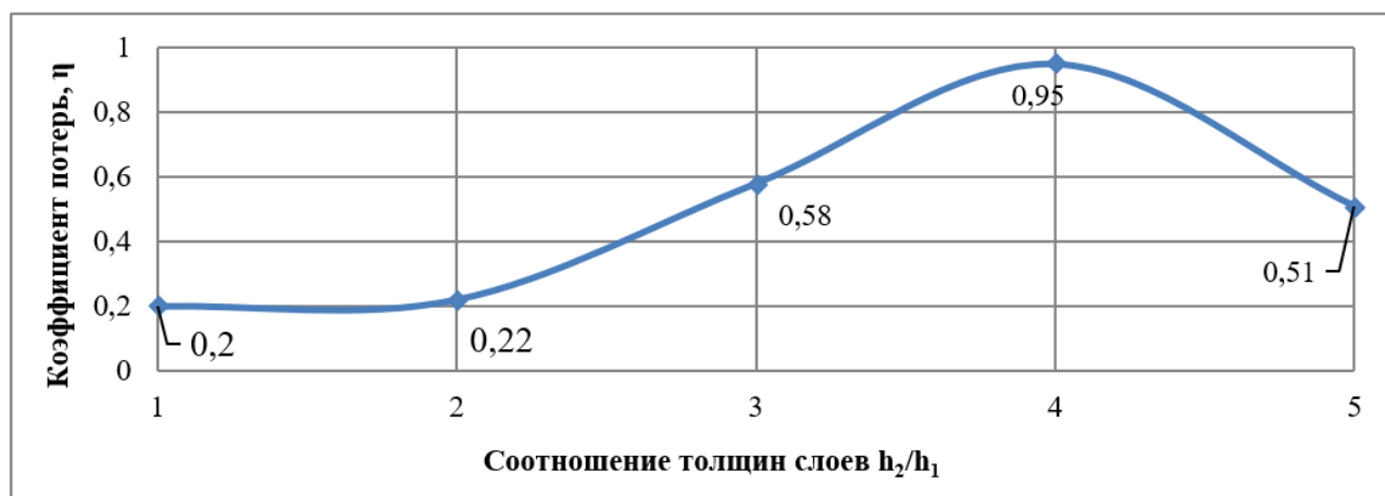
Рисунок 3 – Коэффициент потерь слоистого материала (амплитуда колебаний 2 мм)

Показано, что слоистые материалы более эффективно работают при больших вибрациях. Это вызвано тем, что возрастают сдвиговые деформации в промежуточном слое.