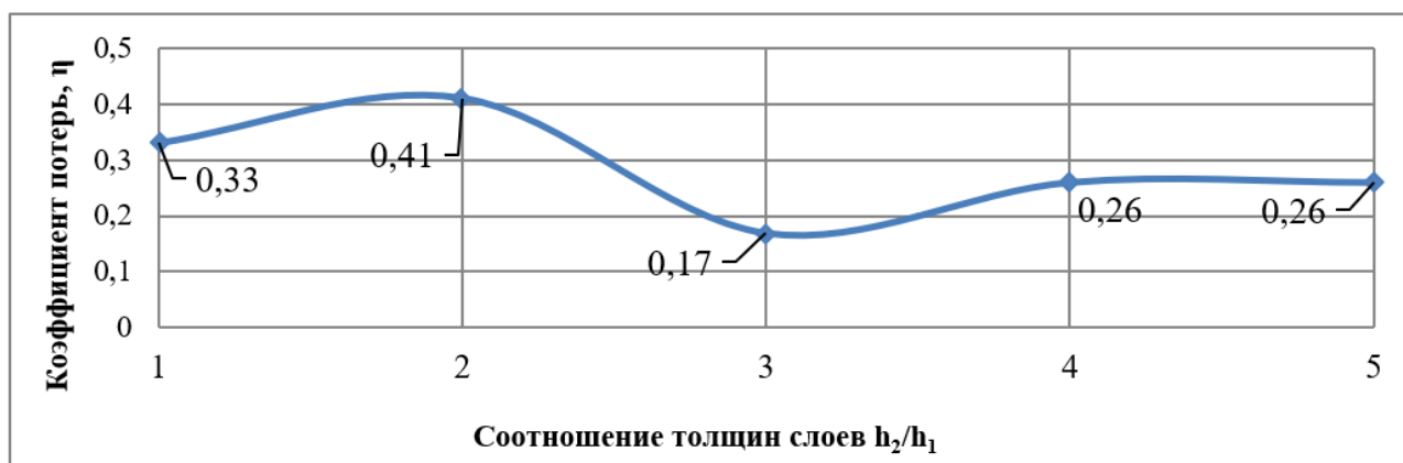
Рисунок 2 – Коэффициент потерь слоистого материала (амплитуда колебаний 1 мм)

Конструкция слоистого материала характеризуется соотношением слоев. Соотношение толщин слоев определяется условиями работы материала. Показано, что при амплитуде колебаний 1 мм – h_2/h_1 = 2 , а при амплитуде колебаний 2 мм – h_2/h_1 = 4 , результаты приведены на рисунках 2 и 3.